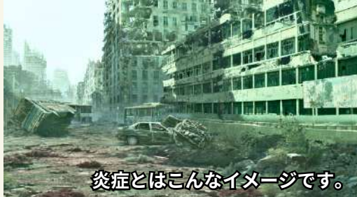
炎症とはこんなイメージです。