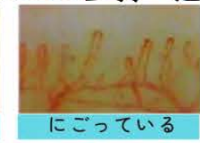
にごっている ●老廃物が多い ●代謝が悪い ●疲労・睡眠不足