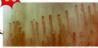
体のすみずみまで栄養や酸素が行き届いている状態が最も理想的