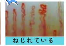
ねじれている ●体の酸化 ●生活習慣に原因あり